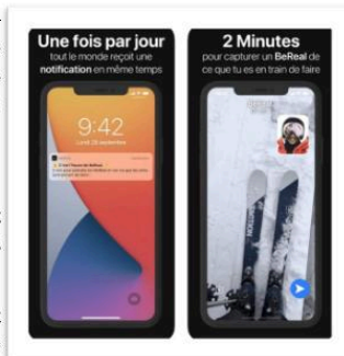
Publicité de BeReal

Si un utilisateur est trop confronté à des opinions avec lesquelles il est en