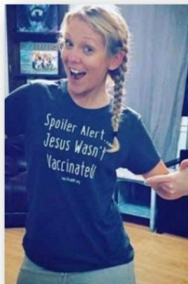
Photo d'une antivax étant devenue virale autour de 2019