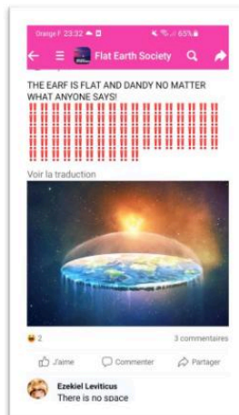
Capture d'écran d'une communauté Facebook complotiste

Cela s'est vu avec le mouvement antivax: La théorie du complot dénigrant l'efficacité des vaccins. En 2019, l'OMS considérait déjà cette hésitation vaccinale comme un des 10 plus grands risques pour la santé mondiale, et ce avant la crise du COVID-19.