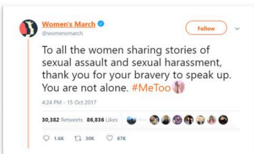
Les images sans sources sont des captures d'écrans prises sur les réseaux sociaux

Sa fonctionnalité phare, le Hashtag, et la taille limitée de ses messages, ont engendré des discussions enflammées et propagé des débats de façon virale. De même, chacun à sa manière, d'autres réseaux fournirent des plateformes de sensibilisation et de débat.