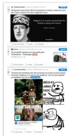
Le flux Reddit d'un compte vierge

Cette "chambre d'écho" a donc une dimension individuelle. Chaque individu fournit un ensemble de données à l'algorithme par ses actions sur le réseau, que cet algorithme utilise pour construire un écho à ses opinions et intérêts, qui se